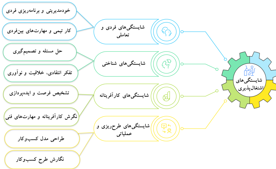
شکل ۲. شایستگی‌های اشتغال‌پذیری در کتاب کارگاه کارآفرینی و تولید