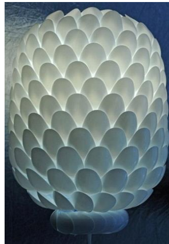
شکل ۱- تلفیق هنر تجسمی و مواد دور ریختنی و ایجاد گل