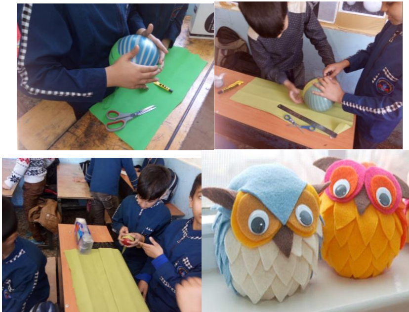
شکل ۳- تلفیق نقاشی با هنر دستی (هنر تجسمی)

شکل ۲- تلفیق داستان سرایی و نمایش همراه با موسیقی خلاقانه دانش آموزان