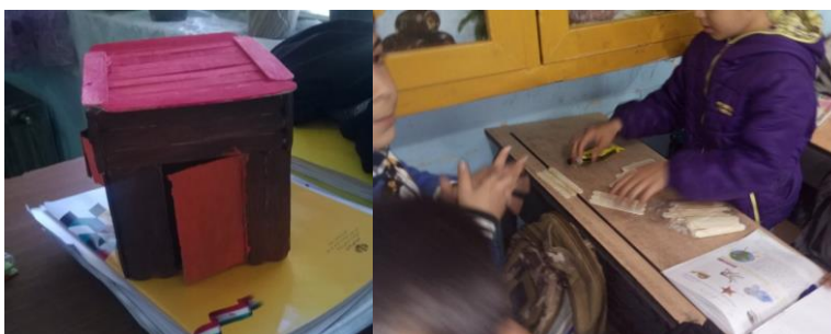
شکل ۹- تلفیق کاردستی و خلاقیت ذهنی (هوش چندگانه)