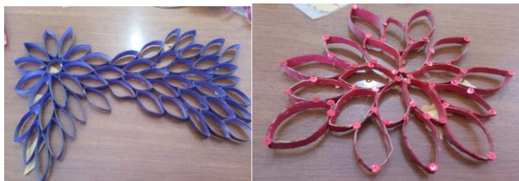
شکل ۷- تلفیق هنر تجسمی با نقاشی همراه با وسایل دور ریختنی