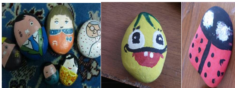
شکل ۴- تلفیق هنر نقاشی با هنرهای بصری تجسمی و تبدیل به شخصیت‌های داستانی