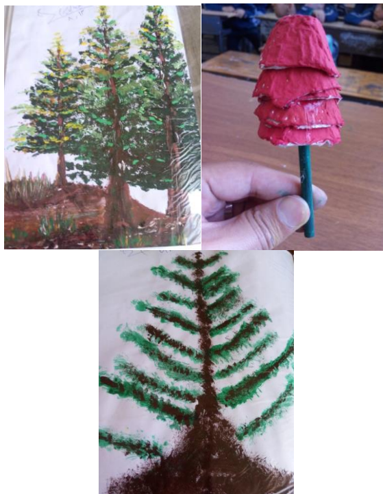
شکل ۵- تلفیق هنر نقاشی پرتابی با هنر گرافیکی یا هنر تجسمی