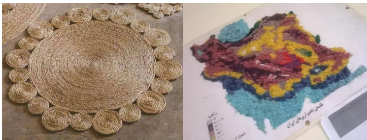
شکل ۸- تلفیق هنر نقاشی با هنر تجسمی: برجسته کاری (به کمک کف و کاموا)