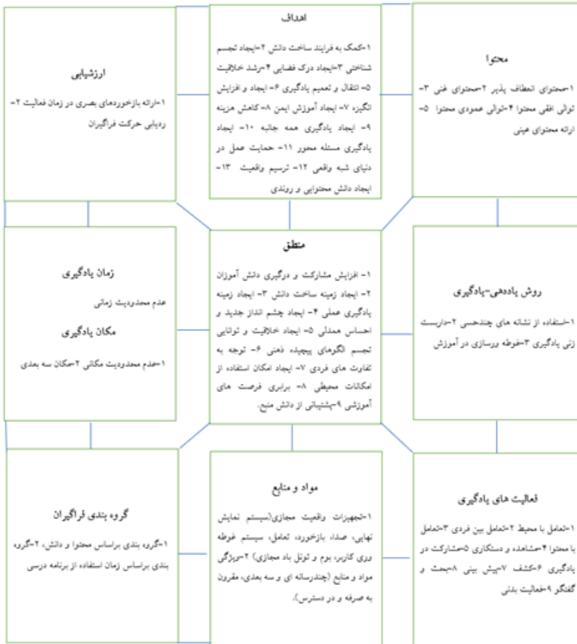
شکل شماره ۲: الگوی برنامه‌درسی مبتنی بر واقعیت مجازی در درس علوم

با توجه به نتایج حاصل از سنتز پژوهی و کدگذاری باز و محوری، به‌طور کلی الگوی برنامه‌درسی مبتنی بر واقعیت در درس علوم دوره‌ششم ابتدایی به‌صورت زیر می‌باشد: