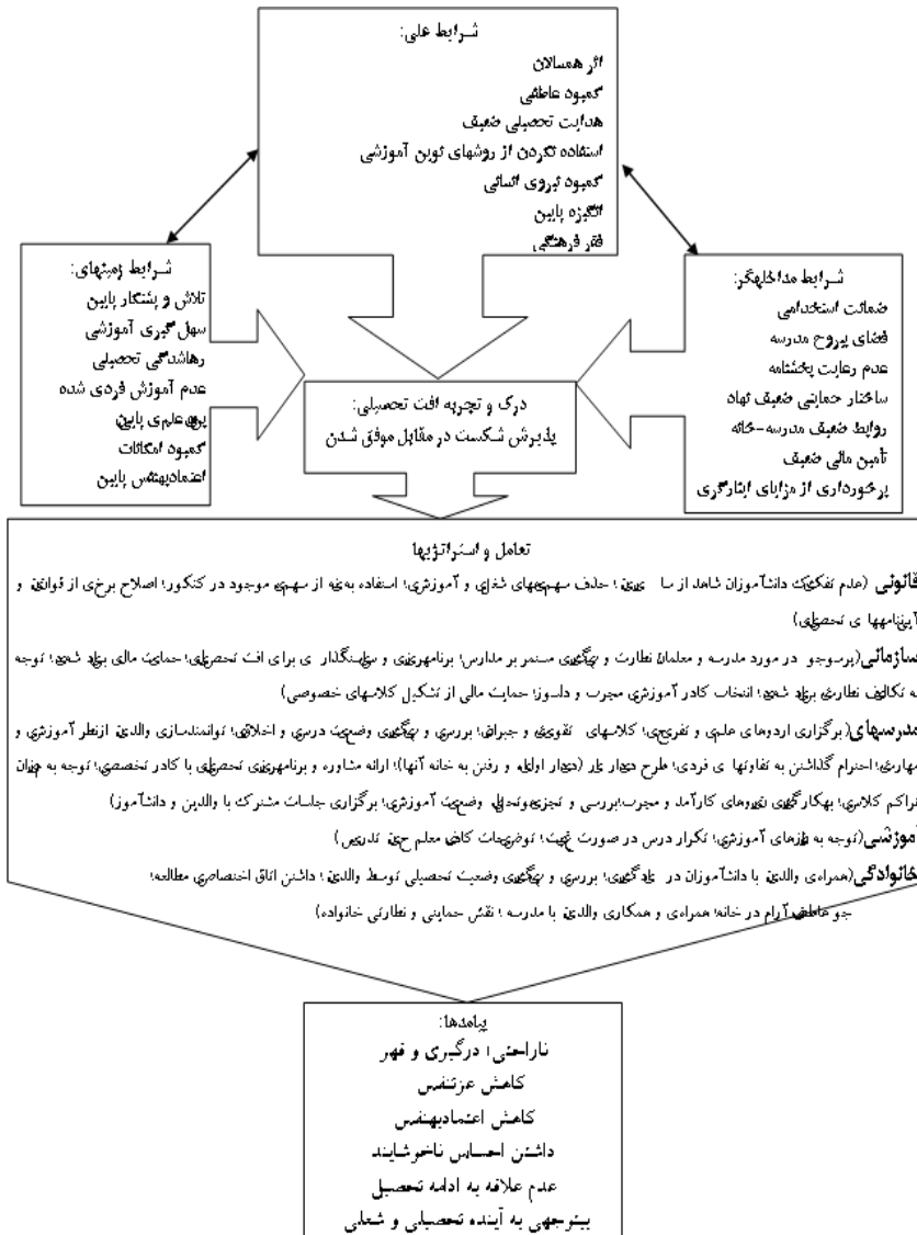
شکل ۲- مدل پارادایمیک: افت تحصیلی به‌مثابه پذیرش شکست در مقابل موفق شدن

در مدل پارادایمیک پژوهش (شکل ۲)، کنشگران درگیر در افت تحصیلی، این پدیده را به‌مثابه «پذیرش شکست در مقابل موفق شدن» درک و تجربه می‌کنند.